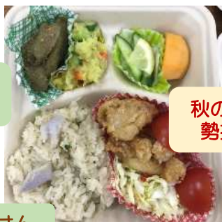
秋の味覚が 勢揃い!