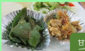
甘辛みそ炒め ご飯がすすみます