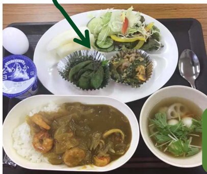
いわき産コシヒカリ 「いわきライキ」も いただきました！