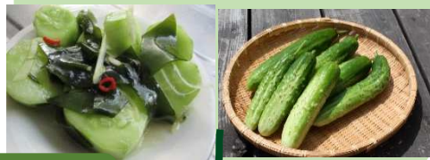
ごま油・昆布だしで さっぱりピリ辛

びっくりするほど大きくもなりますが、程よい大きさのものは素敵なグリーン色でかわいいです。黄色の花と緑色のツルが頑張って絡み合っていてトンネルが出来ますが、この光景を見ると作ってよかったなぁと感動します。たくさんの方にいろんなレシピで食べてもらえたら嬉しいです。来年も頑張ってお作りしたいです！