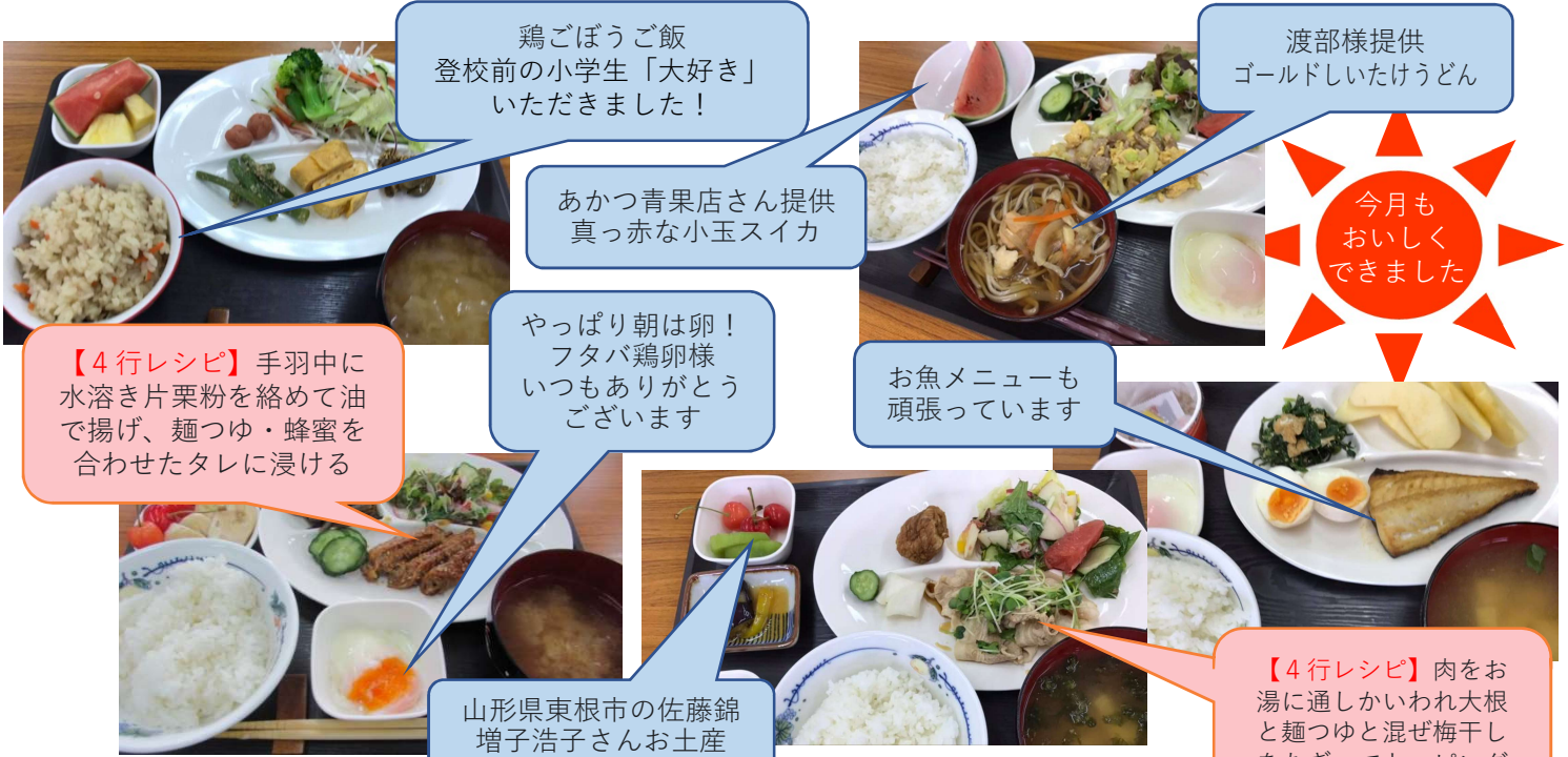
鶏ごぼうご飯 登校前の小学生「大好き」 いただきました！